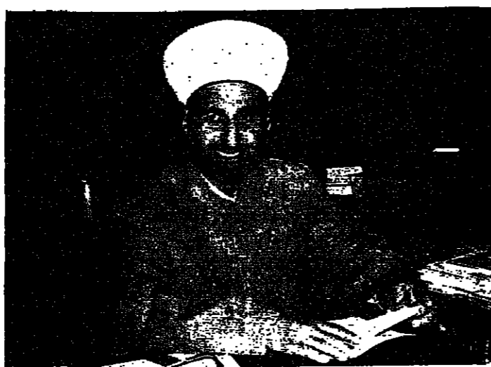
زالت الطائفية السياسية موجودة

● ما هي المراحل الفروخ تلمبا للرسول إلى حل نهائي كحل ؟ □ لكن صريحين ... ليس هناك من سياسة مراحل ، لأن المشكلة في لبنان واحدة وهي تسييس الطوائف .. أن الطوائف في لبنان هي خيول يركبها مقوم السياسيين بمدد أن يطورها مقامر الديوان ... هذه الطائفية السياسية تكسب عيسى الحكم تسمكا بباقيات تارة وتوصفا في السلطة تارة أخرى ، كما تحسب على الإدارة ، وعلى التربية ، وعلى الجيش ، وعلى الاقتصاد ، وعلى الجميع فسادا واستجارا بوجود المواطنين وبقرانهم ... المرحلة الضرورية للوصول إلى الحل النهائي هي مرحلة واحدة - الجيتي ، وهي المرحلة السياسية ، والتي هي المرحلة التي فيها يتكلمون عن الديمقراطية السياسية ، والتمسك بين الزعماء مع انفسهم من جهة ومع بعضهم البعض من جهة أخرى ، والتفكير بين من سوسوا بالتفكيرين من جهة والمجدين من جهة أخرى . وعلى المستوى الاجتماعي فمسلكه التناقض الحاد بين ثلة القراء والمستضعفين ، وثلة المعتمدين ، والثقلين ، وعلى المستوى الثقافي ، هناك التناقض بين الثقافات ، وعلى المستوى الطائفي هناك التناقض بين دعاة السياسة الطائفية الذين هم من لون واحد ، وبين دعاة السياسة الوطنية الذين هم من لون آخر . أنها تفتقد لا تنتمي لحدود ولا لحدود جغرافية ولا لحدود ثقافية ولا لحدود لغوية ، وإنما هي مرحلة التنفيذ لحل كل التناقضات الموجودة في لبنان ... وعلى ذلك يجب في لبنان أن هناك محلا واحد لا يدخل له حل كل هذه التناقضات ... وهذا التناقض الطائفي هو في مبدئه وفي موضوعه وفي غاية أمر سياسي لا دخل للدين فيه من قريب أو بعيد ... والسيسيون الذين يستفيدون من هذا التناقض هم وحدهم المسؤولون ، فمنذنا ينظر هؤلاء السادة إلى استعادة لبنان ، لا استعادة الأية ، ويومنون في التخلي عن تسمكهم للطائفية الطائفية